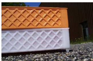
Cajas llenas sin altos

La gama de productos con mismas dimensiones :