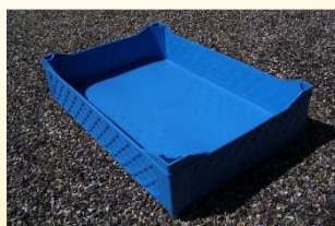
Cajas llena con altos

Altos : alturas de 20 mm sobre las cuatro esquinas de la caja