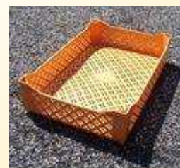
Cajas rejadas con altos